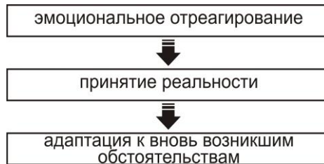
Рис. 1. Фазы выхода из стрессового состояния

Вторая фаза — воздействие — характеризуется выраженными эмоциональными реакциями на событие и его последствия. Это могут быть сильный страх, ужас, тревога, гнев, плач, обвинение — эмоции, отличающиеся непосредственностью проявления и крайней интенсивностью. Постепенно эти эмоции сменяются реакцией критики или сомнения в себе. Она протекает по типу «что было бы, если бы...» и сопровождается болезненным осознанием неотвратимости происшедшего, признанием собственного бессилия и самобичеванием. Данная фаза является критической в том отношении, что после нее начинается либо «процесс выздоровления», либо происходит фиксация на травме и последующий переход постстрессового состояния в хроническую форму. В последнем случае человек остается на второй фазе реагирования. При благополучном эмоциональном отреагировании возникает третья фаза — фаза нормального реагирования. Ее можно представить в виде схемы (рис. 1).